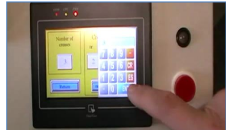
Programmations : panneau LCD à touches sensibles (affichage en Français)